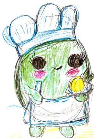
Оливка «Ливи» Автор – Маруся Иванова